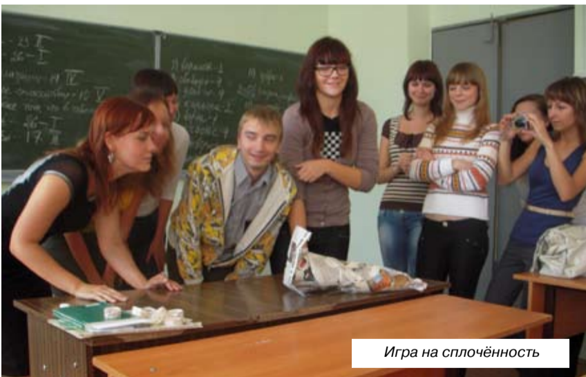
Игра на сплочённость

В прошлом году силами студентов – членов клуба было проведено социологическое исследование, целью которого являлся сравнительный анализ профессиональных и личностных характеристик, а также этической культуры верующих студентов в вузах города. В этом году тематику наших встреч в клубе мы сформулировали сами. На основании опроса студентов была составлена иерархия ценностей, из которой были выбраны наиболее значимые. Сюда вошли: семья и любовь, здоровье, дружба, самореализация и т.д. Эти вопросы и стали темами встреч в текущем году. Они проходят в различных формах – это могут быть дискуссии, презентации, мини-спектакли.